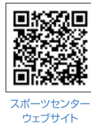
スポーツセンターウェブサイト

申込方法 (1) 電子申請(スポーツセンターウェブサイトからお申し込みください) (2) 電話、来所(県立スポーツセンター・藤沢市善行)、または下記「事前申込書」によりファクシミリでお申し込みください。