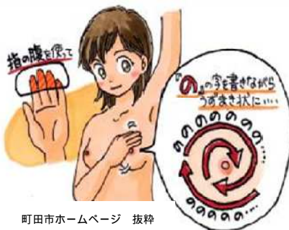
町田市ホームページ 抜粋

乳がんは、自分で早期に発見できる唯一のがんです。日々の生活の中で、自分で見てさわり、異常がないかチェックしましょう。