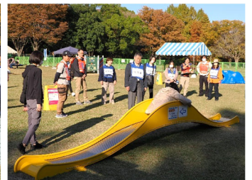
遊具体験会の見学状況