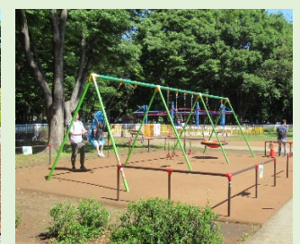
一般型とインクルーシブ型の両方の座面がある3連ブランコ