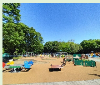
外周柵に囲まれた見通しの良いインクルーシブ遊具広場

東京都の砧公園の様子や、都庁の職員と砧公園の園長にヒアリングを行った結果を報告しました。