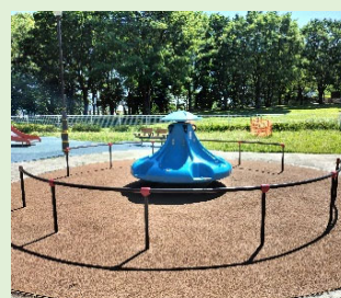
外向き座りの回転遊具のため車いすから移乗しやすい