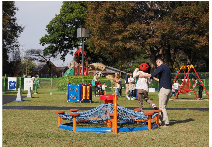
遊具体験会の様子