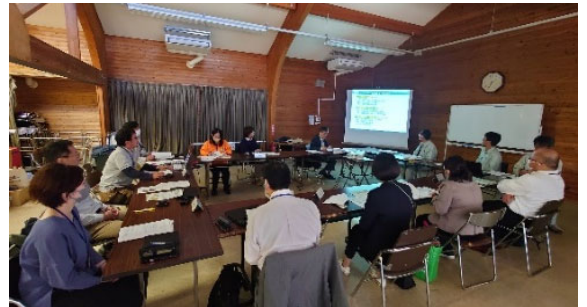
ワーキングの様子