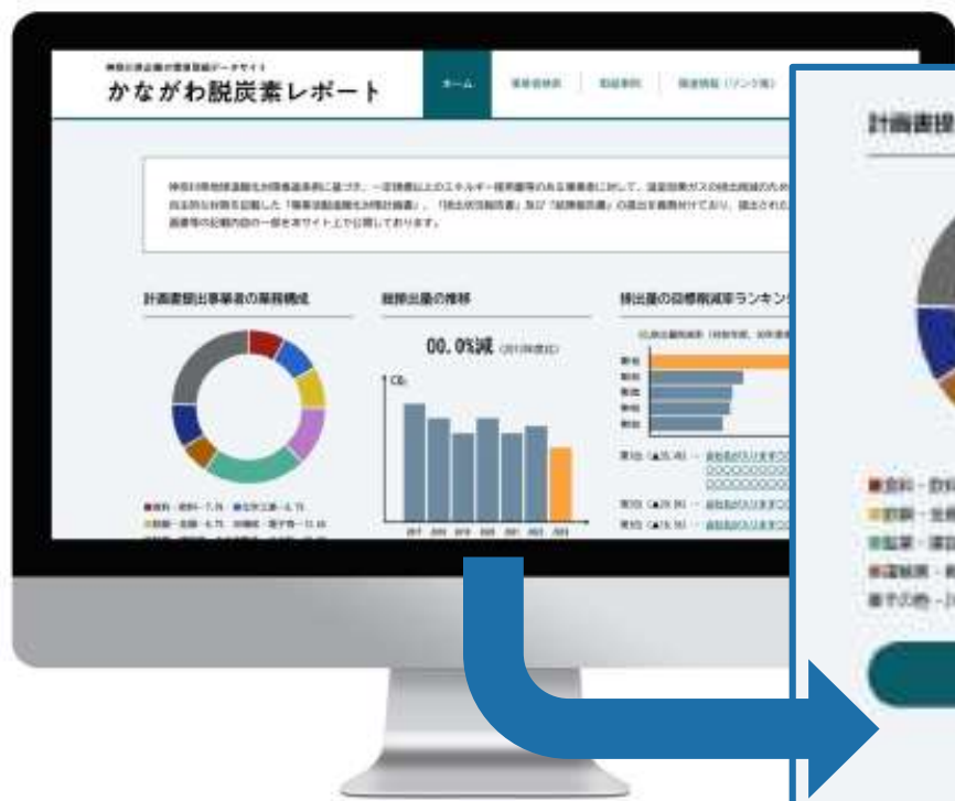
特設サイトTOPページ（まとめ情報ページ）のイメージ