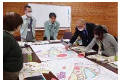
大判の図面上に遊具を模したパーツを置きながら配置を検討しました。