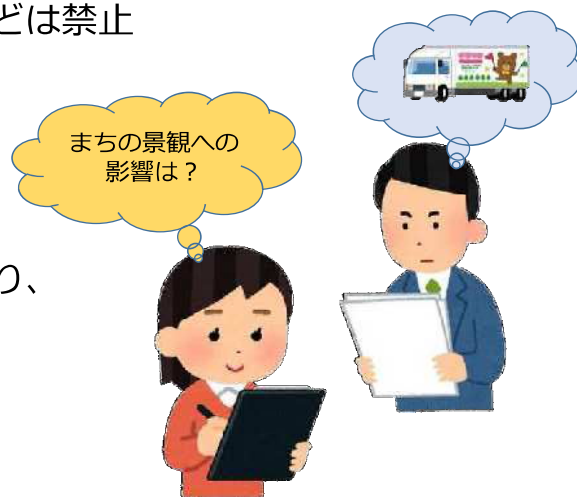
デザイン審査のイメージ