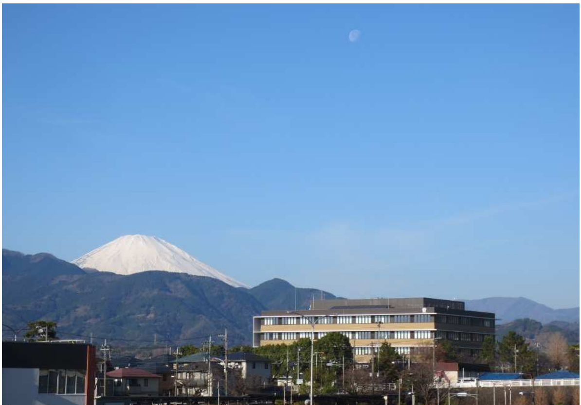
足柄上合同庁舎（令和3年12月撮影）