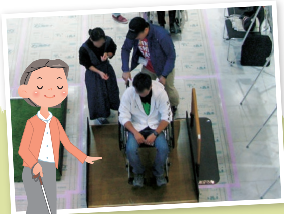
車いすに乗ってみよう