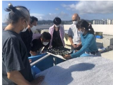
漁業就業促進センターでの研修風景

漁業就業促進センター修了生も含む新規就業者への資格取得助成を新設するとともに、就業者の受入側である漁協等向けのセミナーを新規開催することで定着化を支援するほか、漁業体験研修や漁業就業セミナーを引き続き実施することで就業を支援する。