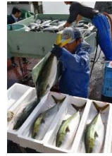
魚の選別・箱詰め