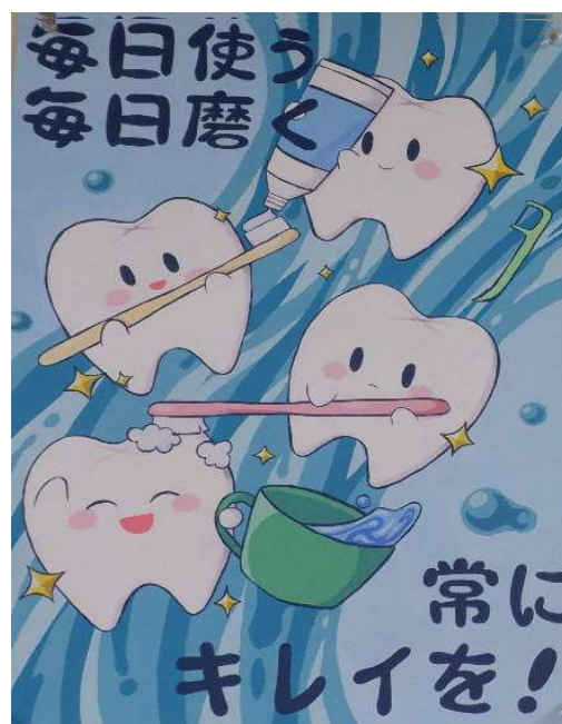
第4部 (中学校全学年)