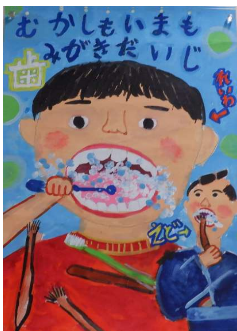
第1部 (小学校1・2年生)