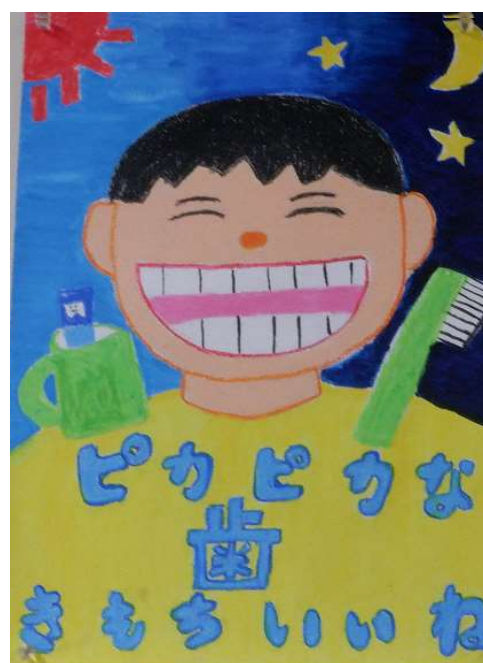
第2部 (小学校3・4年生)