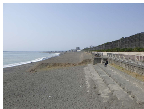
(養浜 (茅ヶ崎市中海岸))