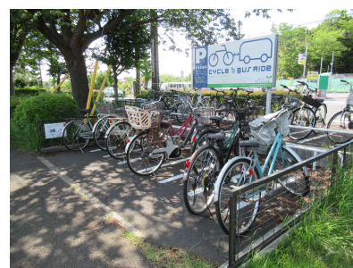
(矢尻バス停サイクルアンドバスライド)

また、UTMSのサブシステムである公共車両優先システム(PTPS)により、路線バスのスムーズな運行を確保し、マイカーからの転換を促しています。さらに、車両の分散誘導によって排気ガス等を低減し、環境の改善を目指す交通公害低減システム(EPMS)を川崎市南部に導入しています。