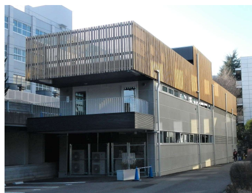
施設の木質化 (神奈川大学)

県民が木材の良さに触れる機会を増やし、森林資源の有効活用が森林環境の保全につながることをPRしています。