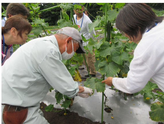
農業研修を受ける研修生 (かながわホームファーマー事業)