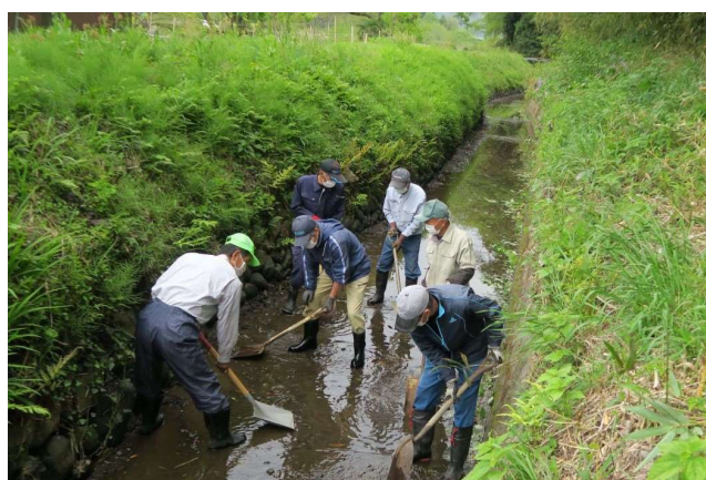
地域ぐるみで実施する水路の一斉清掃 (多面的機能支払事業)