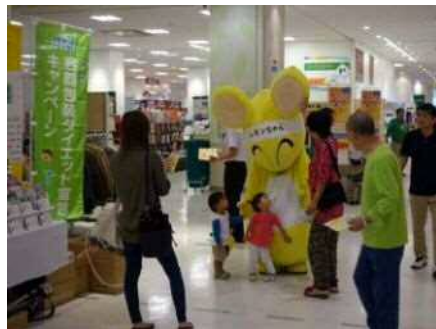
アリオ橋本店【相模原市】