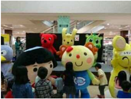
アピタ長津田店【横浜市】 (キックオフイベント)