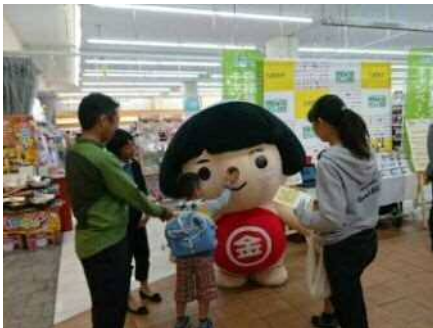
F U J I 寒川店【神奈川県】