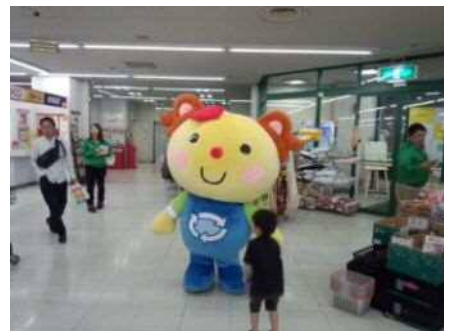
マルエツ宮前店【川崎市】