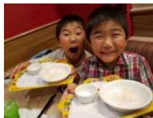
主なフォト部門入選作品