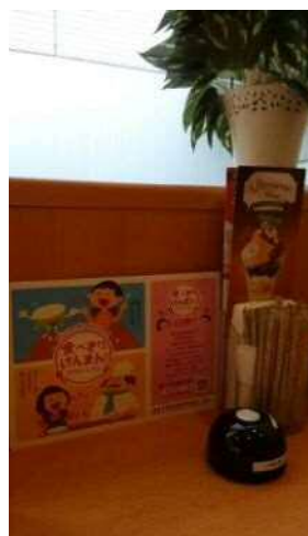
キャンペーンの様子