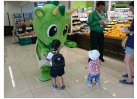
TAIRAYA 浦和栄和店【さいたま市】