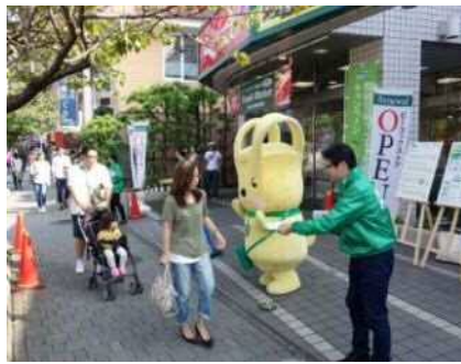
ピーコックストア桜新町店【東京都】