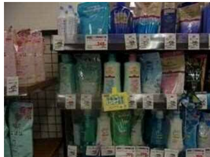
POPによるキャンペーンの様子