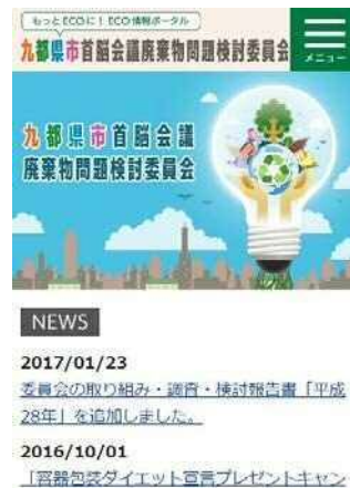
(スマートフォンブラウザ)