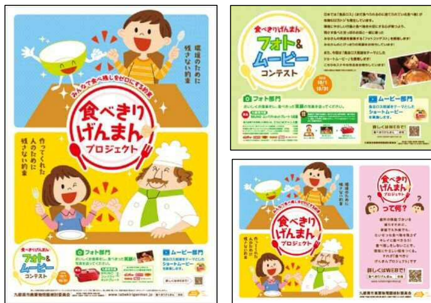
キャンペーンポスター

店頭でのポスター掲示のほか、「食品ロス」の現状やキャンペーンの告知などを記載したPOP等をテーブルに配置し、食事が提供されるまでの時間にご覧いただけるようにした。