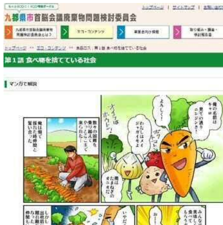
(食品ロスについて)

九都府市共通のテーマである「子供向け」と「食品ロス」をテーマに親しみやすいマンガを用いたコンテンツを作成した。