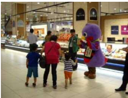
イオン春日部店【埼玉県】