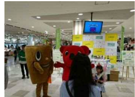
ダイエーいちかわコルトンプラザ店 【千葉市】