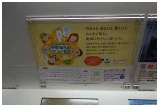
※ 3線群（路線図上の太線の線区）に掲出