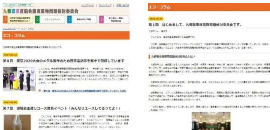
コラムコンテンツ

廃棄物行政について、九都県市職員が定期的に情報発信できるコンテンツを作成し、毎月当番都市を決めて配信するなどのルールの整備を行った。