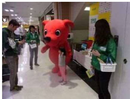
イオンスタイル鎌取店【千葉市】