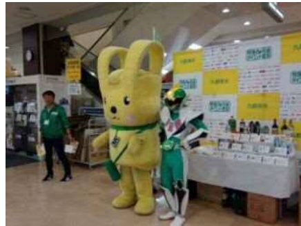
アピタ長津田店【横浜市】