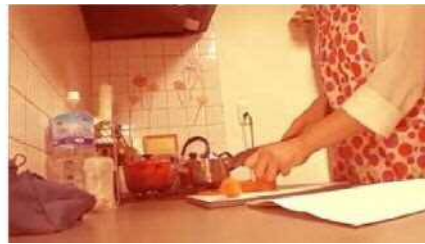
主なムービー部門入賞作品