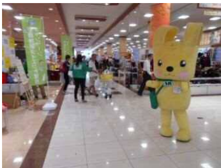
ライフ江北駅前店【東京都】