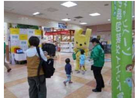
そうてつローゼン磯子店【横浜市】