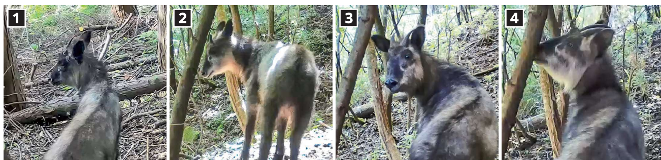
図3 識別が可能だった個体

1: 左角が根本から折れている、2: 左角の先端が折れている、 3: 角折れがなく顎下の毛が黒い、4: 角折れがなく顎下の毛が白い