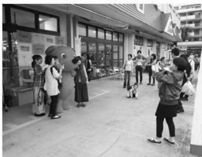
マルエツ東習志野店【千葉県】