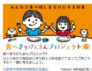
スマートフォン用インフィード広告