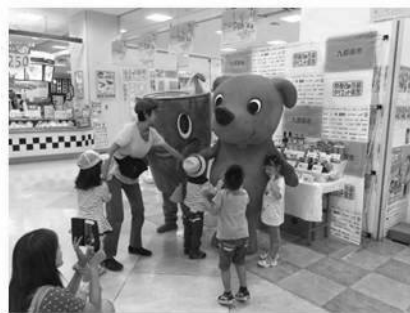
ダイエー千葉長沼店【千葉市】