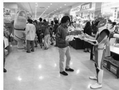
アピタ長津田店【横浜市】