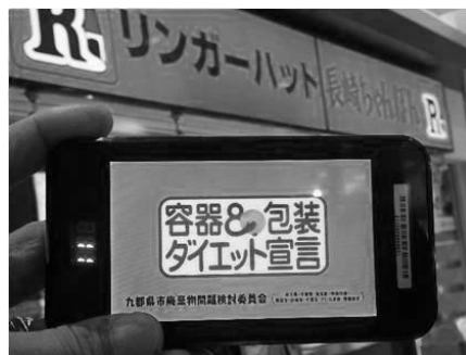
フードコートサイネージ