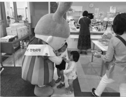
ミアクチャーナ辻堂駅前店【神奈川県】