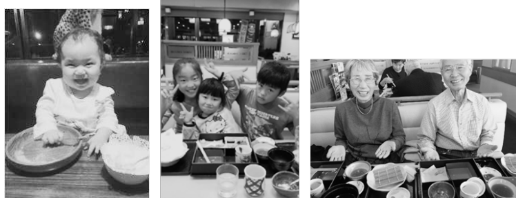
主なフォトコンテスト入選作品