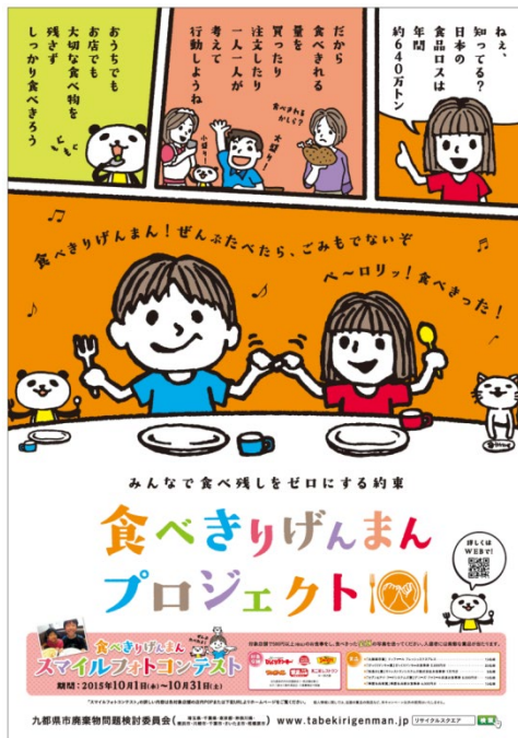
キャンペーンポスター

店頭でのポスター掲示のほか、「食品ロス」の現状や家庭でできる工夫などを記載したPOP等をテーブルに配置し、食事が提供されるまでの時間に御覧いただけるようにした。