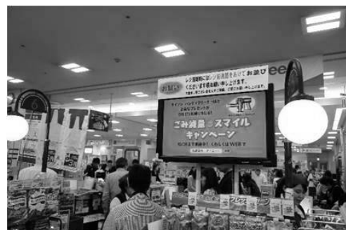
イオンチャンネル