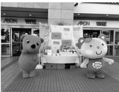
イオン新百合ヶ丘店【川崎市】