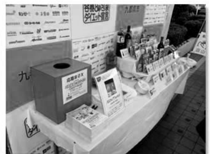
ピーコックストア桜新町店【東京都】