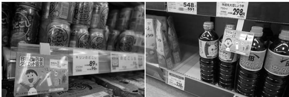
POPによるキャンペーンの様子