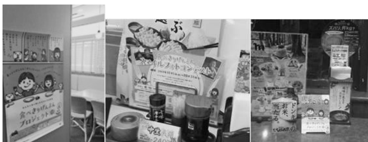
キャンペーンの様子