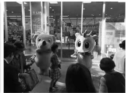
ライフさいたま新都心店【さいたま市】