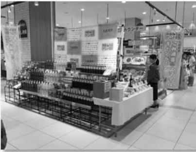
イオン春日部店【埼玉県】