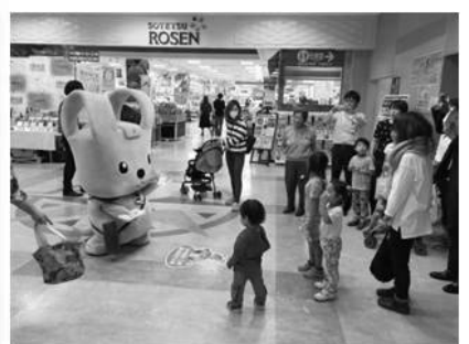
そうてつローゼン磯子店【横浜市】