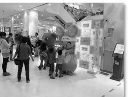
アリオ橋本店【相模原市】