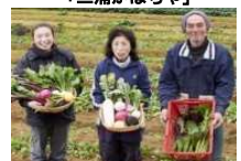
多品種のイタリアン野菜