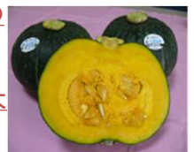
かながわブランド「三浦かぼちゃ」