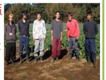
若手農業者の皆さん