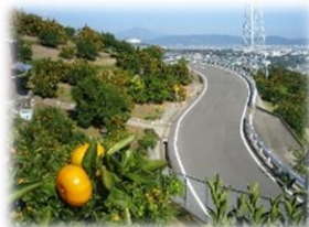
都市住民による柑橘類の摘取り体験