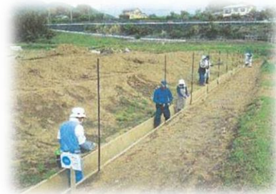
鳥獣害防止柵の設置活動 (中山間地域等直接支払交付金)