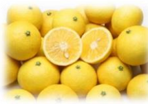
かながわブランド「湘南ゴールド」