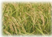
かながわブランド「はるみ」