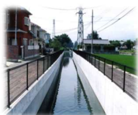
排水路の断面拡幅