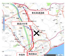
冠水による避難経路の喪失