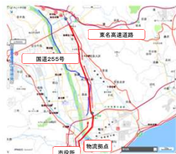
避難経路の確保が実現