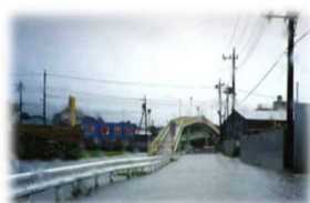
冠水している主要道路