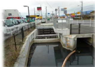
排水路の複線化による機能強化(主要道路の冠水防止に貢献)