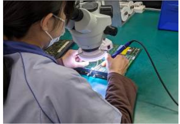
作業風景：基板への電子部品のはんだ付け

最新鋭設備の導入を積極的に進めるほか、作業員にタブレットを支給し、作業実績等を入力する生産管理システムを導入している。