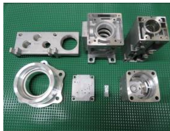
製品写真：空圧機器・自動車・電気部品

最新鋭設備の積極的な導入により生産プロセスの改善に努め、製品の品質及び生産性の向上に結び付けている。