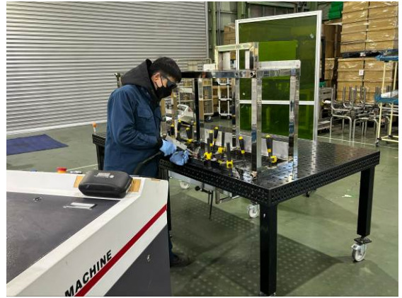
作業風景：食品異物検査機のフレーム作成

安心、安全を大前提として、長年の実績から設計者の意図を汲みつつ、最新・最適な技術を使って短納期高品質に対応している。