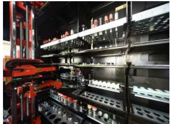
設備写真：金型ステーション

最後まで誠意を貫き通し、誠実に向き合う「至誠一貫」の経営理念を、全社員で共有している。