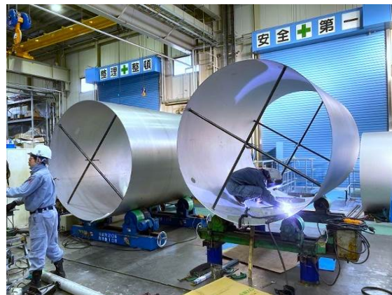
作業風景：ステンレス製丸タンクの製作

また、効率的な生産ラインを実現することにより大型製品（直径3 m以上）の生産を可能とし、強い競争力を有している。