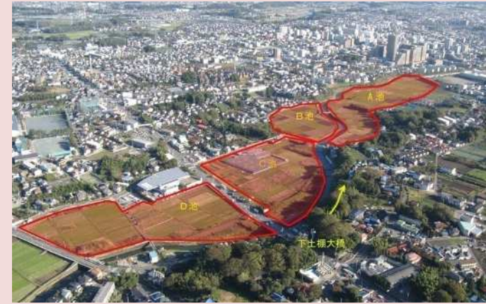
改修前の状況(下土棚遊水地)

現在、下土棚遊水地では、遊水地が平常時に多目的に利用することができることから、地域の憩い・安らぎの場、地域活動・交流の場などを新たに創出することを目的に、遊水地の上部利用施設の整備に取り組んでいます。