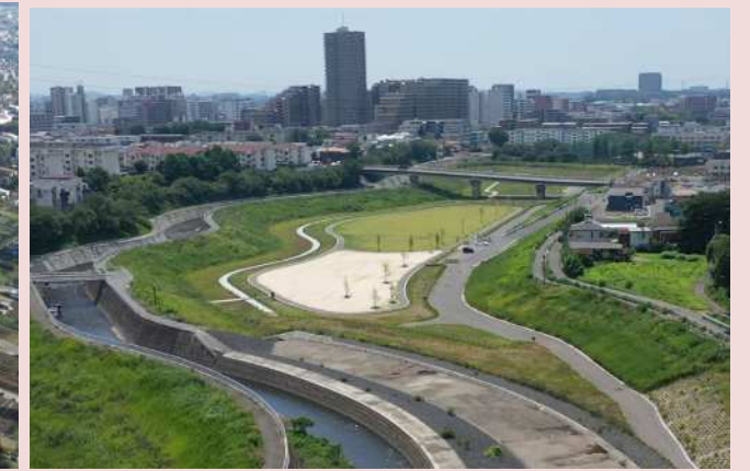
改修後の状況(下土棚遊水地A池)