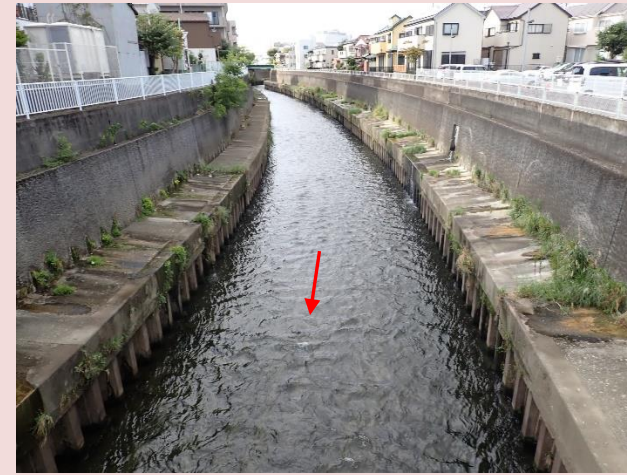
遊行寺橋上流（狭窄部）

特に、沿川に住宅等が連坦し、河道拡幅や河道掘削による整備が困難な藤沢橋付近の狭窄部で、治水対策の検討を進めています。