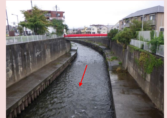
藤沢橋上流（狭窄部）