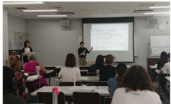
初心者向け日本語講座の様子