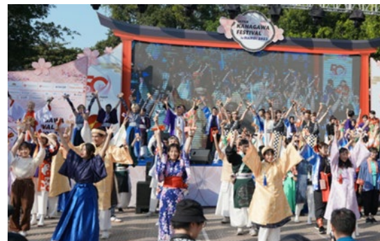
KANAGAWA FESTIVAL 2023