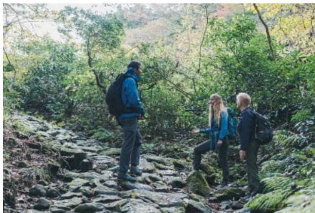
⑨、⑪ 海外の旅行会社を対象としたプロモーション