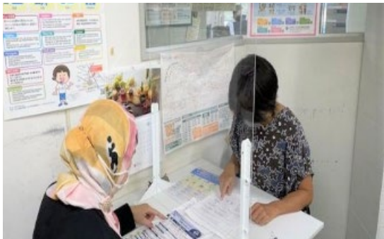
多言語支援センターかながわでの相談の様子