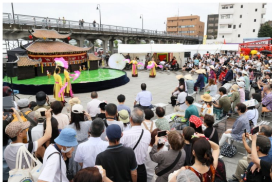
ベトナムフェスタ in 神奈川 2023