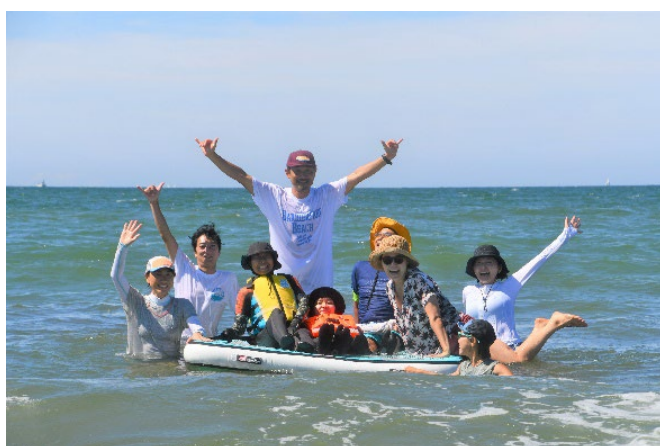
かながわバリアフリービーチ (海水浴の体験)