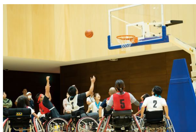
かながわパラスポーツフェスタ (車いすバスケットボール)