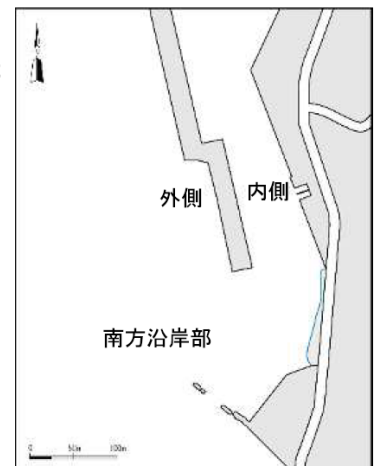
図 4.2-1 確認された海藻類・魚類等