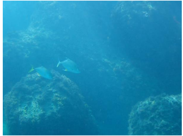
消波堤内側のギンガメアジ属