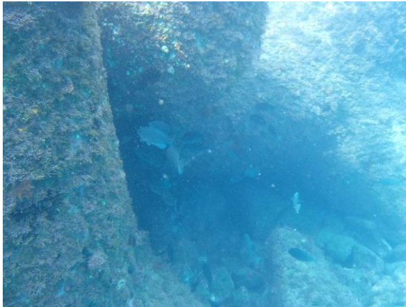
消波堤内側のメジナ