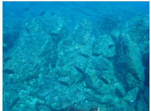
消波堤外側のスズメダイ