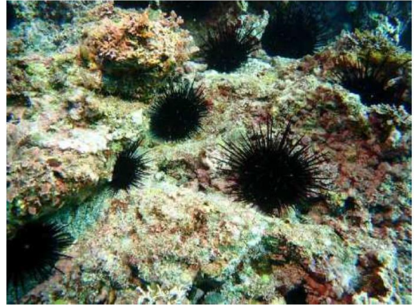
南方沿岸部周辺のムラサキウニ