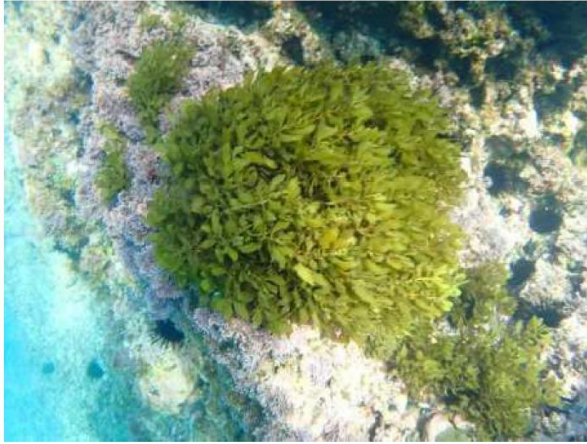
南方沿岸部のイソモク