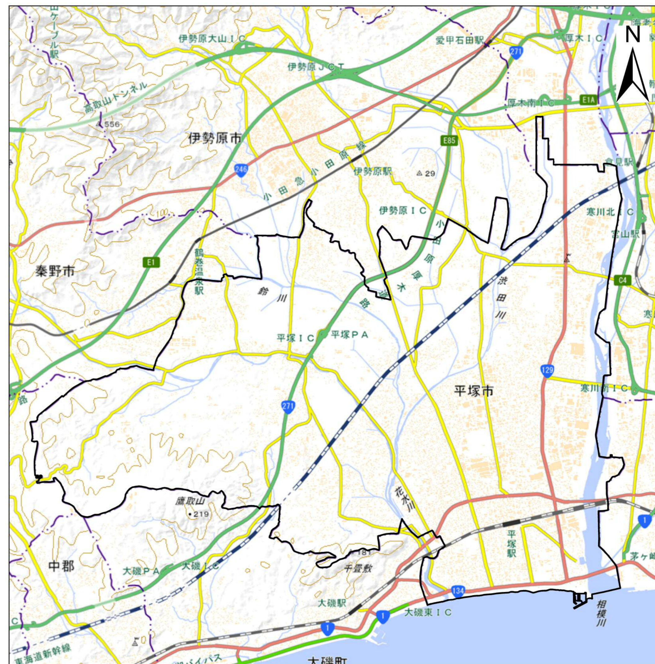
詳細位置図 (S= 1:60,000) (A2)