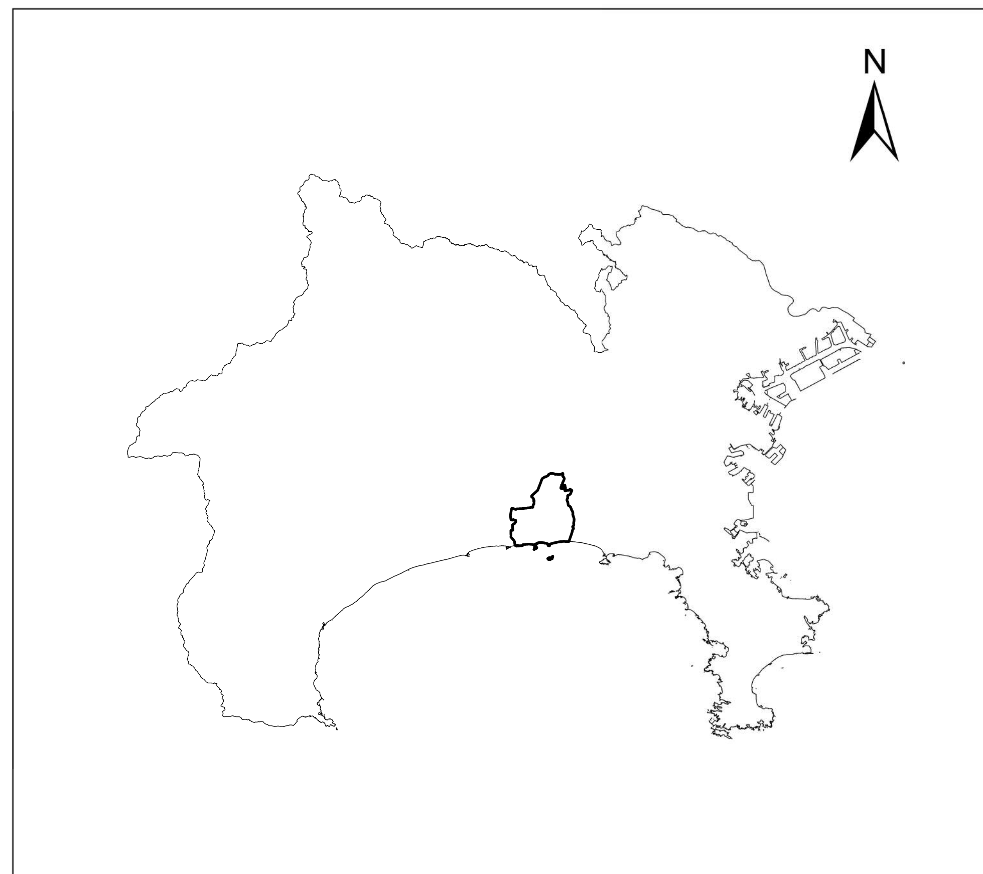
全体位置図 (S=1:500,000) (A2)