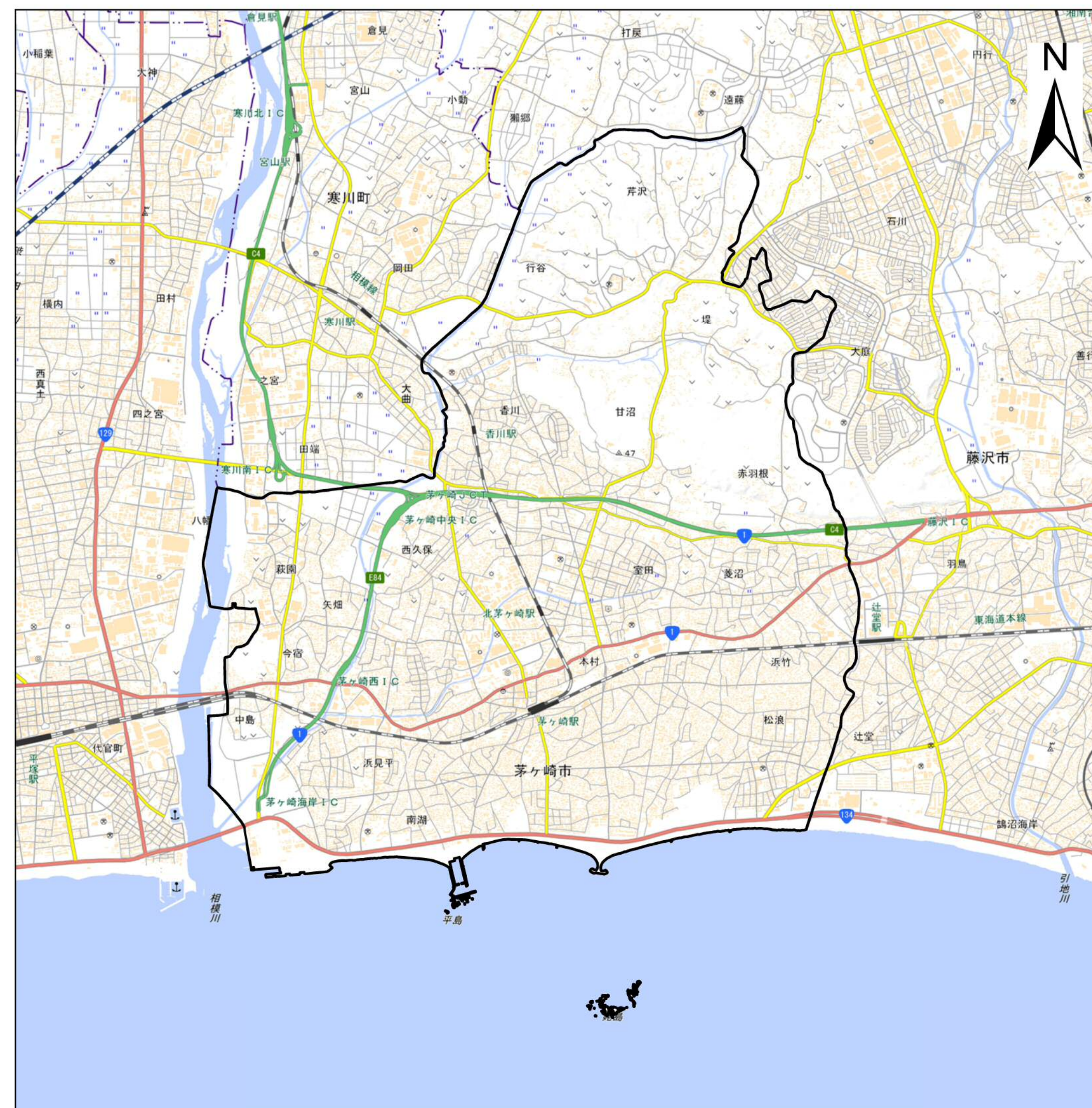
詳細位置図 (S= 1:50,000) (A2)