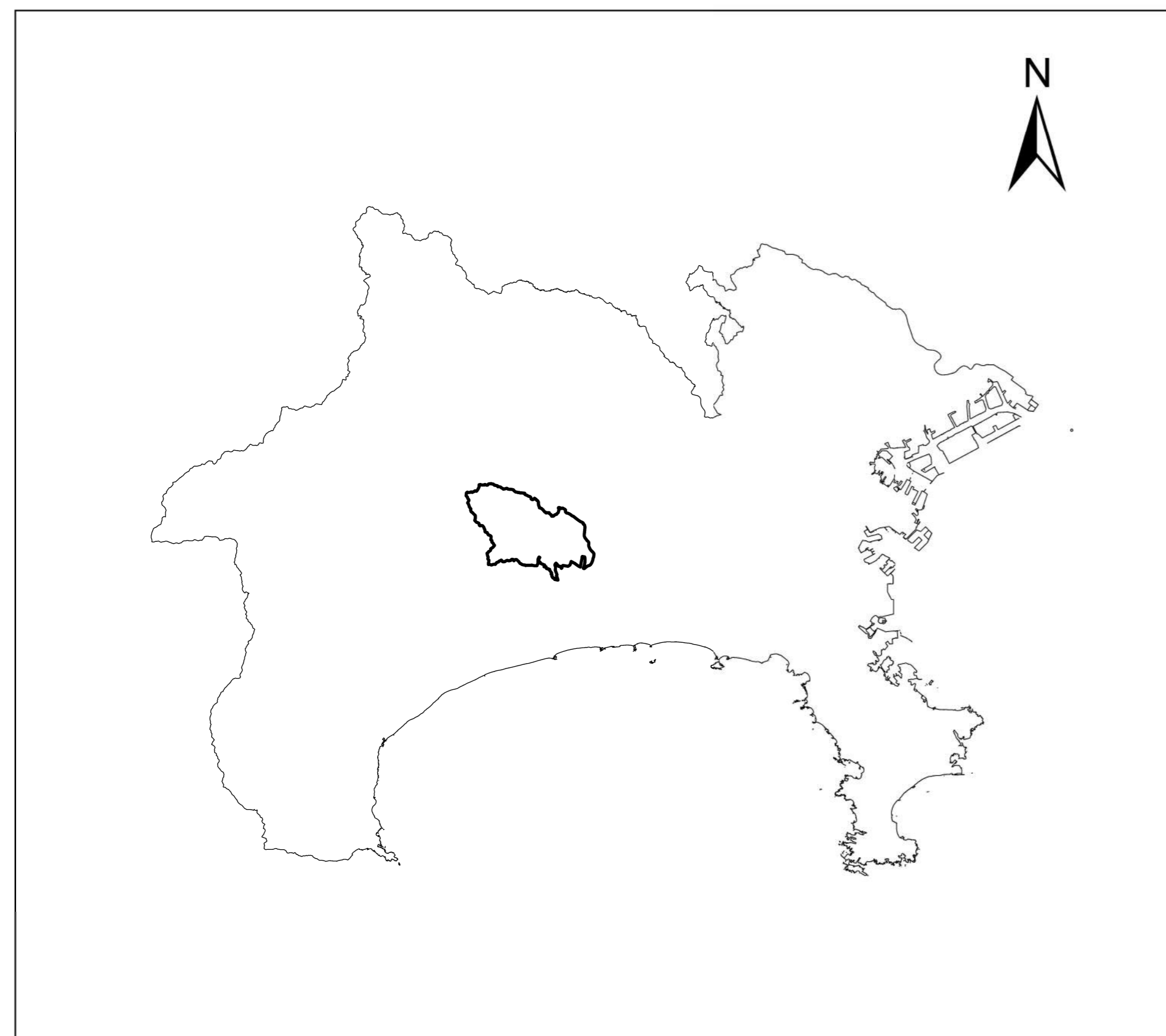
全体位置図 (S=1:500,000) (A2)