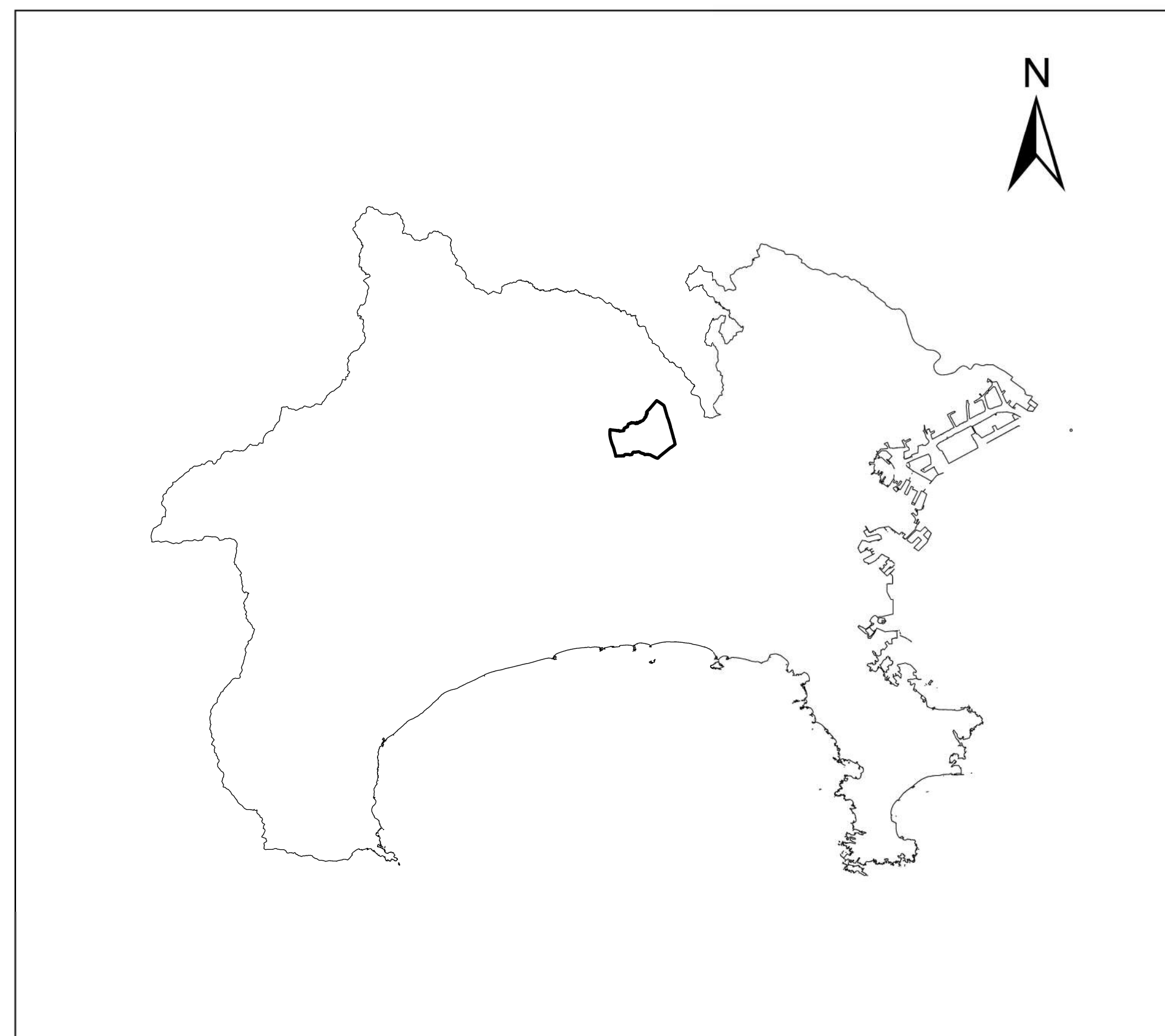
全体位置図 (S=1:500,000) (A2)