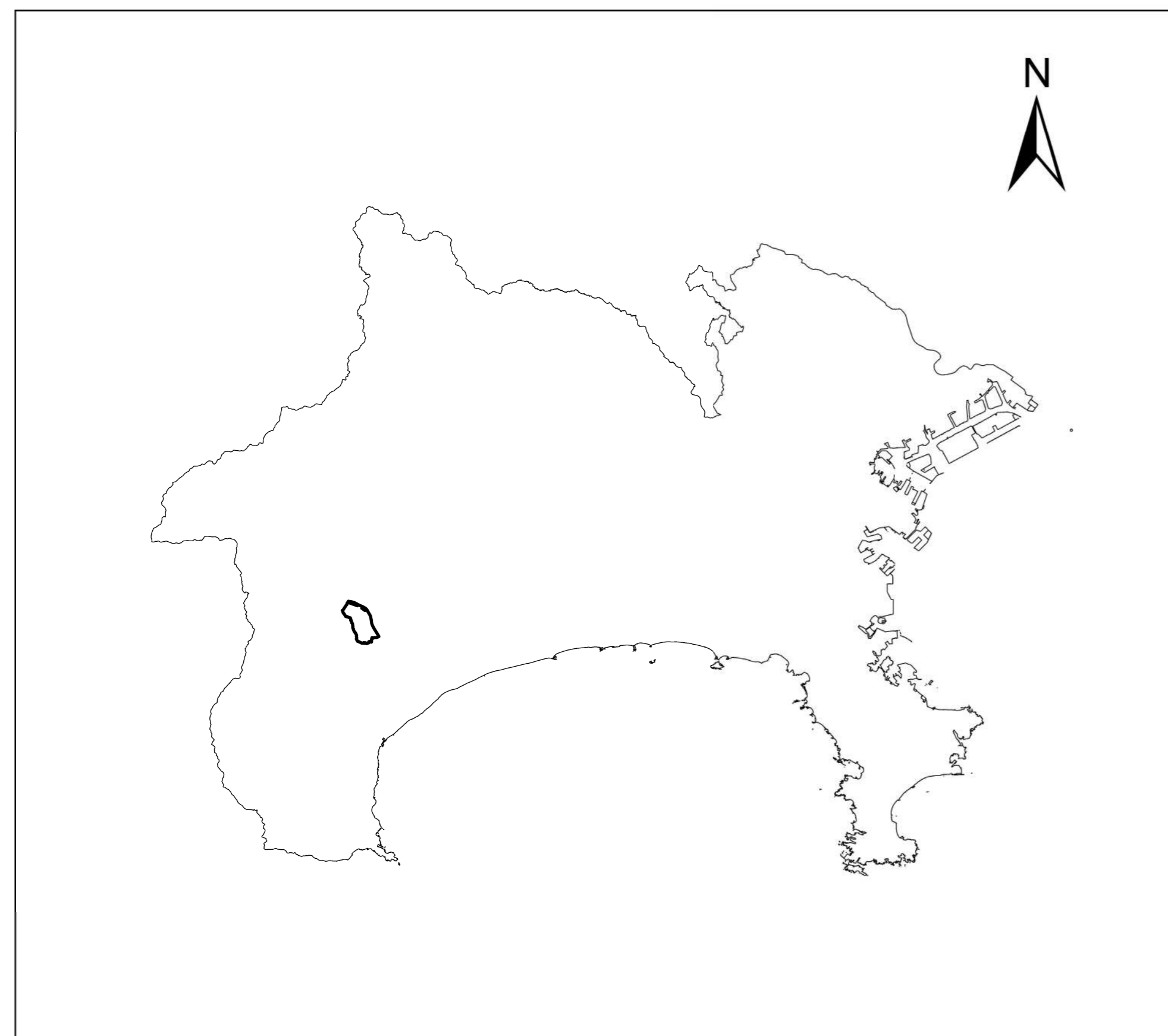
全体位置図 (S=1:500,000) (A2)