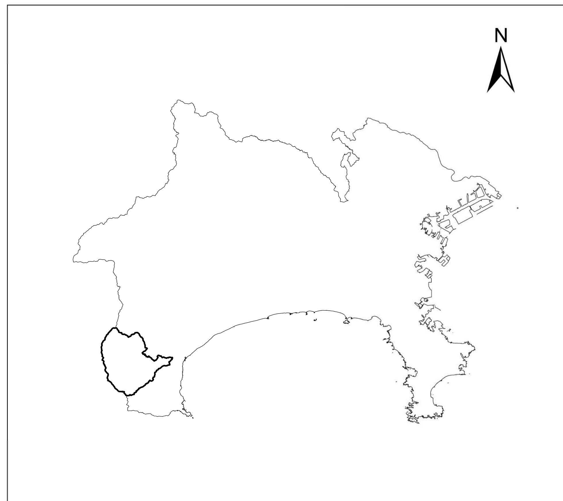
全体位置図 (S=1:500,000) (A2)