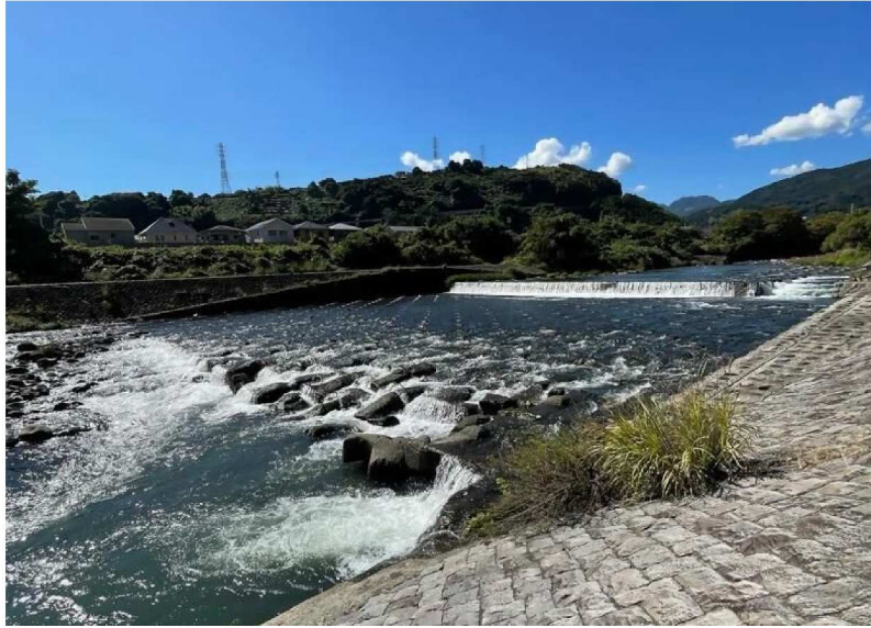
写真1 小田原用水取水口堰堤(下流端)