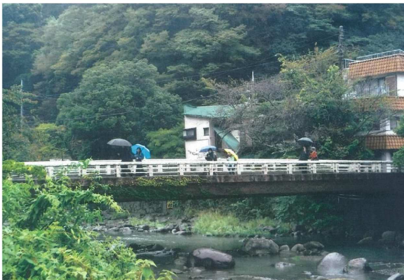
写真2, 3 箱根町湯本 688 番地先湯本橋(下流端)