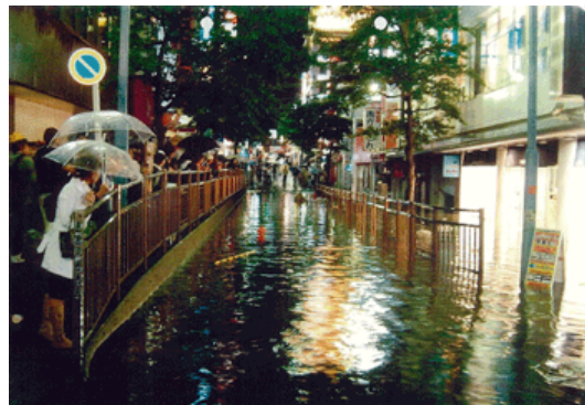
平成16年台風22号による横浜駅西口付近 における浸水状況(帷子川)