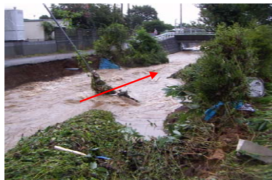
平成20年8月末豪雨による境川の風戸橋上流付近 における堤防の被災状況(境川)