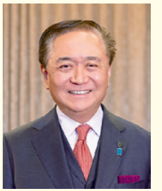
神奈川县知事 黑岩 祐治