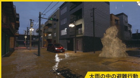
大雨の中の避難行動