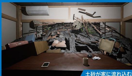
土砂が家に流れ込む