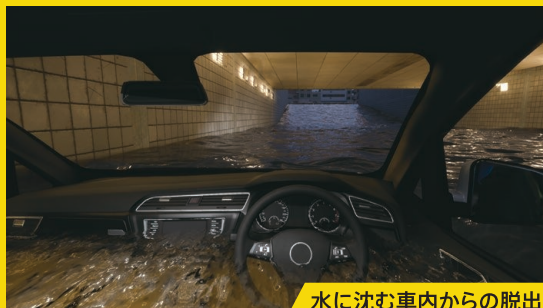
水に沈む車内からの脱出