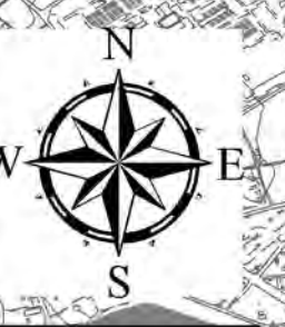
相模川水系中津川洪水浸水想定区域図(浸水継続時間)