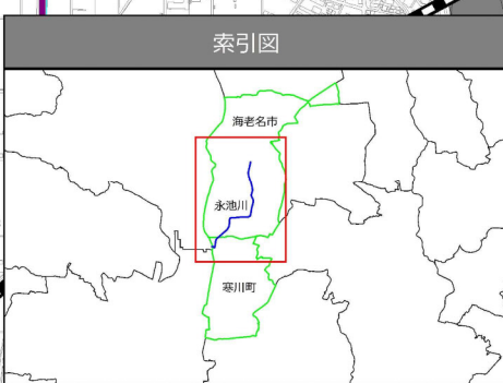
相模川水系永池川洪水浸水想定区域図（計画規模）

1 説明文 この図は、相模川水系永池川の水位周知区間について、水防法の規定に基づき計画降雨により浸水が想定される区域、浸水した場合に想定される水深を表示した図面です。 この洪水浸水想定区域図は、現時点の永池川の河道及び洪水調節施設の整備状況を勘案して、洪水防御に関する計画の基本となる年超過確率1/30（毎年、1年間にその規模を超える洪水が発生する確率が1/30（約3%））の降雨に伴う洪水により、永池川が氾濫した場合の浸水の状況をシミュレーションにより予測したものです。 なお、このシミュレーションの実施にあたっては、永池川の水位周知区間以外の河川等の氾濫、シミュレーションの前提となる降雨を超える規模の降雨による氾濫、高潮及び内水による氾濫等を考慮していませんので、この浸水が想定される区域以外の区域においても浸水が発生する場合があります、想定される水深が実際の浸水深と異なる場合があります。 2 基本事項等 (1) 作成主体 神奈川県 (2) 公表年月日 平成30年12月21日 (3) 告示番号 神奈川県告示 第547号 (4) 根拠法令 水防法(昭和24年法律第193号)第14条第2項 (5) 対象となる水位周知河川 相模川水系永池川 (6) 算出の前提となる降雨 永池川の1時間雨量74mm (7) 関係市町村 海老名市 (8) その他計算条件等 実施区間〔左岸：海老名市大谷366番地 〕から相模川合流点まで 〕 〔右岸：海老名市大谷363番地 〕 ① この図は、永池川において、危険となる水位に達した時点で破堤、堤防のある区間においては越水及び堤防のない区間においては溢水したときの氾濫計算結果を基に作成したものです。 ② 氾濫計算は、対象区域を25m格子（計算メッシュという）に分割して、これを1単位として計算しています。また、計算メッシュの地盤高は国土地理院基盤地図情報（数値標高モデル5mメッシュ）データを使用しています。このため、微地形による影響が表せていない場合があります。