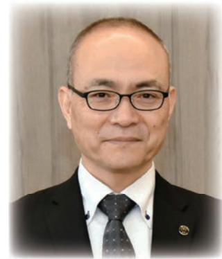
神奈川県教育委員会教育長 (神奈川県租税教育推進協議会会長)

学校関係者の皆様には、今後とも租税教育の推進にお力添えいただけますよう、よろしくお願い致します。