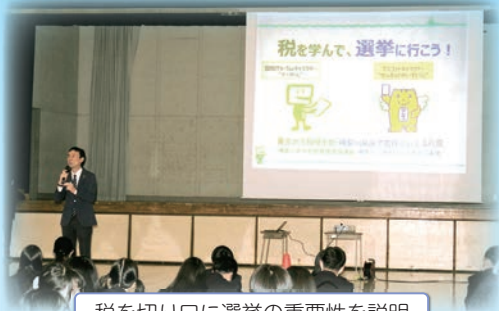
税を切り口に選挙の重要性を説明