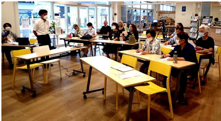
セミナー第一部：認知症と診断される前にやっておきたい相続対策 オープニング