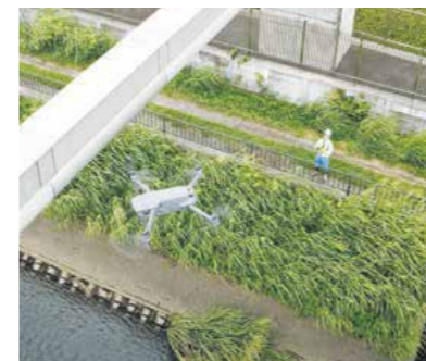
現在もドローンなど新技術を活用し、安心安全を守っています

これからの安全で良質な水をお届けしていくために 県営水道は、昭和8年の創設から90年を迎えました。給水人口わずか4,000人から始まり、戦後に急増した水需要に合わせて水道管などの施設整備を進め、今では県内人口の3分の1にあたる約285万人に安全で良質な水をお届けしています。これからの県営水道を取り巻く環境は、人口減少が進んでいく中、より厳しいものになっていきます。水需要の増加に合わせて整備した多くの水道管が更新時期を迎え、台風や地震など近年大きな被害をもたらしている自然災害への対策など、様々な課題に対応する必要があります。さらに、事業の運営に必要な水道料金の収入は、さらなる減少が見込まれ、水道事業の担い手不足という課題にも向き合わなければなりません。これからも、安全で良質な水をお届けしていくために、県営水道では、30年後の目指す姿を描いた「神奈川県営水道長期構想」を令和6年3月に策定します。4面では、30年後の水道の未来を、現在のデジタル技術などから想像して描きました。水道の未来について一緒に想像してみましょう。