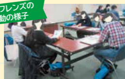
水道フレンズ交流会 災害時の水の備蓄について意見交換を行う様子