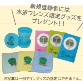
※写真は一例です。グッズの指定はできません。