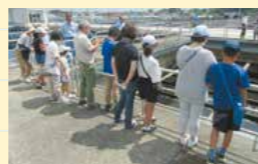
親子de水道フレンズ 寒川浄水場見学の様子