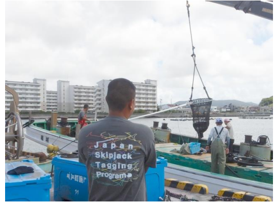
再捕記念品を着る漁業者