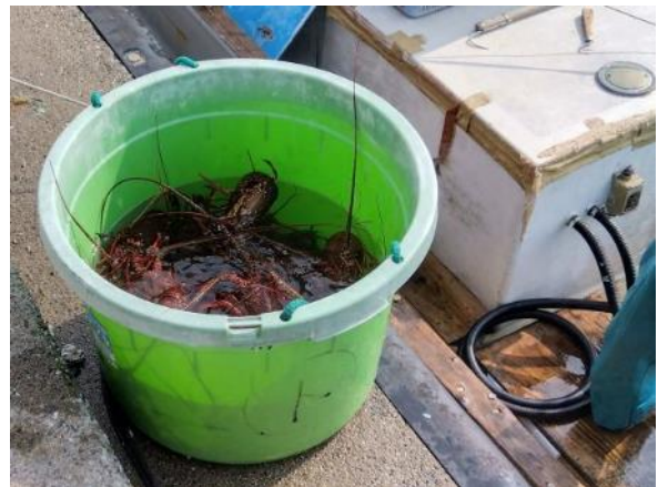
刺網で獲れたイセエビ