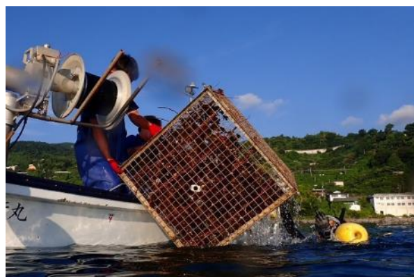
藻場礁の引き揚げ作業の様子