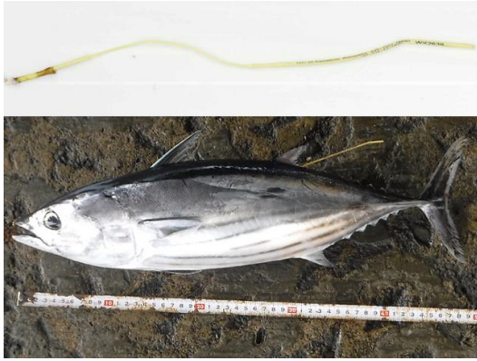
約 20cm の標識、装着した様子(和歌山県水産試験場)