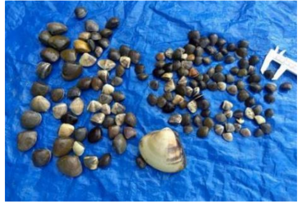
採捕された稚貝(親貝は比較用)