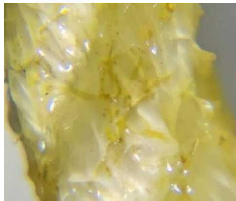
黄色い帯状に見えるのがワカメの幼葉(芽胞体)