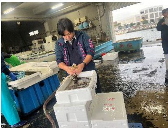
各漁協の注文分を仕分け

11月27日、横須賀市東部漁協は、北海道産コンブ種糸（総延長873m）を仲介し、注文のあった11漁協に配布しました。