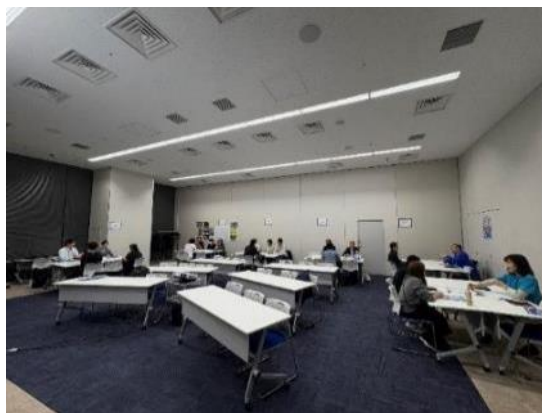
「漁師の仕事！知るセミナー」の様子

11月7日、「漁師の仕事！知るセミナー」が浜松町で「漁師.jp」(一社)全国漁業就業者確保育成センターにより開催され、セミナー後には漁業就業相談マッチングも行われ、神奈川県の漁業就業に意欲的な参加者もいました。