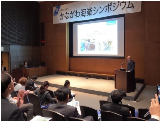
漁協職員による講演