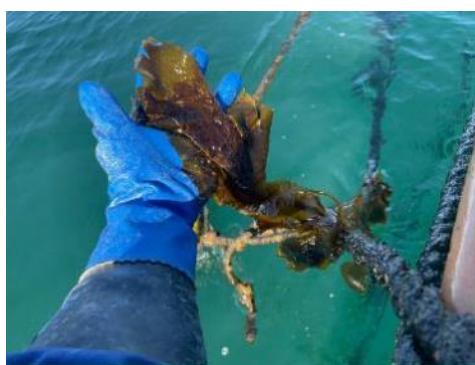
12月上旬の生長状況

横須賀市東部漁協所属の漁業者が養殖するワカメは、12月上旬から生長の速さが顕著であり、12月末には1mに達するものもありました。漁場水温が昨年と比べて順調に低下し、ワカメの生長に適した環境となったことや食害がなかったことが良かったようです。