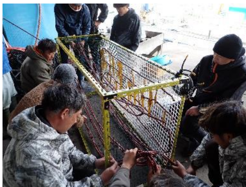
食害防除籠への種苗ロープの取り付け作業

12月22、25日、岩漁協海士会は、藻場再生活動の一環で、岩漁港周辺にアカモク種苗等の設置を行いました。当日は、当センターが生産したアカモク、カジメの種苗を岩漁港周辺に設置しました。設置は、当センター相模湾試験場が作成した食害防除籠に種苗ロープを入れるなど、さまざまな方法で行いました。同会によるアカモクの種苗の設置は今回が初の試みとなるため、食害の状況や今後の生育等が注目されます。