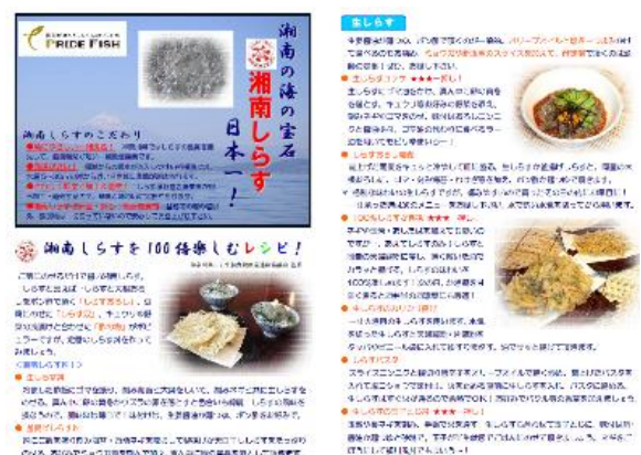
「湘南しらすを100倍楽しむレシピ！」