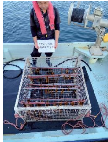
作成したカジメ藻礁