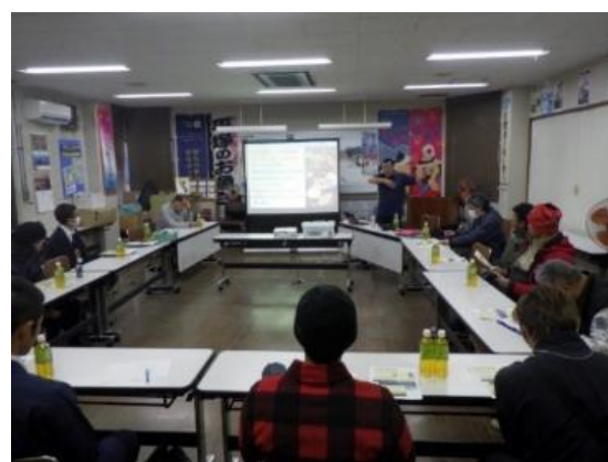
「ハマグリの資源増殖・管理」についての勉強会の様子