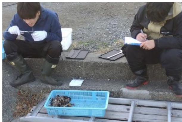
大きさと重さの計測