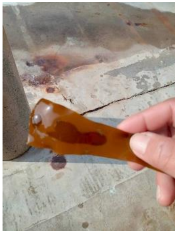
早熟性カジメの子囊班

カジメを使ったスポアバッグの投入及びカジメ藻礁の設置を根府川周辺で行いました。今後、スポアバッグから遊走子が放出、拡散され新芽が生育することを期待しています。