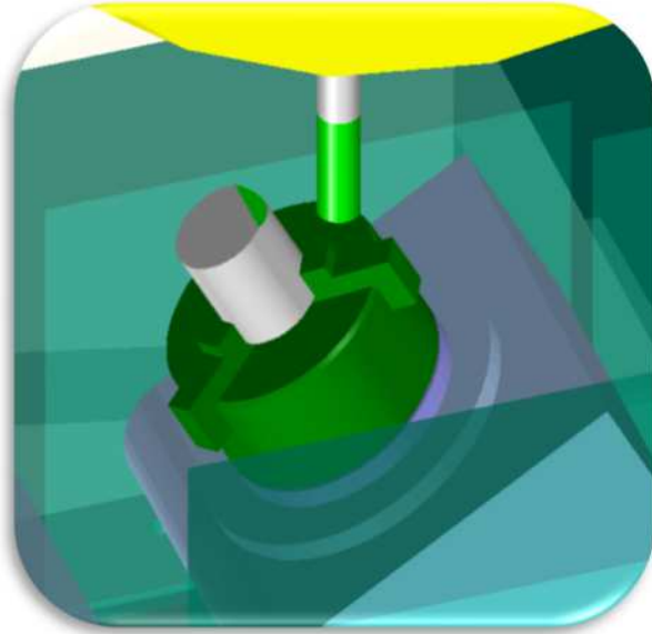
<課題 (例) >