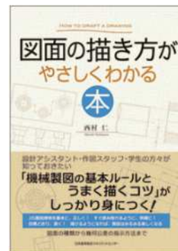
図面の描き方がやさしくわかる本