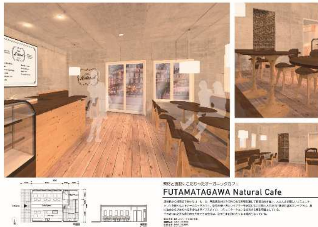
インテリアパース完成イメージ