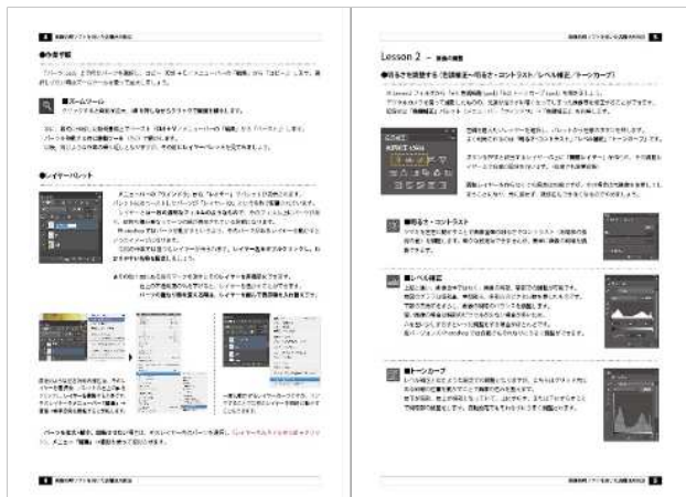
セミナー使用教材(イメージ) ※実際に使用する教材とは異なることがあります。

アドバイスを受けながら制作し、一緒にセミナーを受けている方々からも良い刺激を受けることができます。