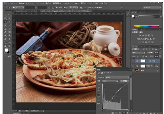
作業画面イメージ