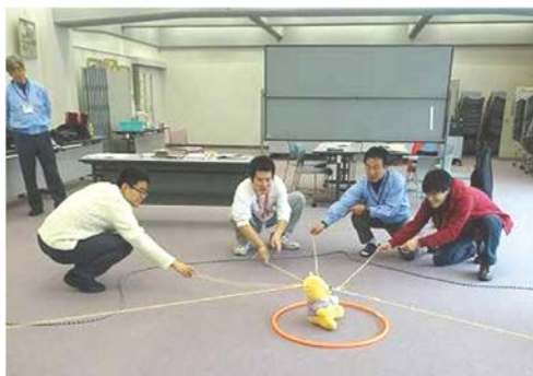
スタート。移動可能エリアからねらう