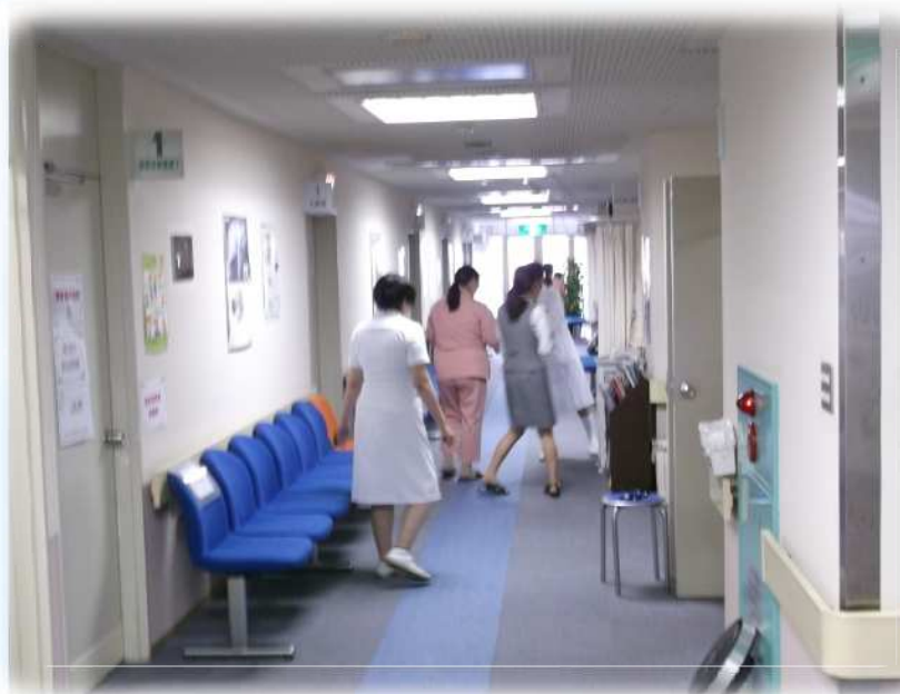
健診フロアの様子