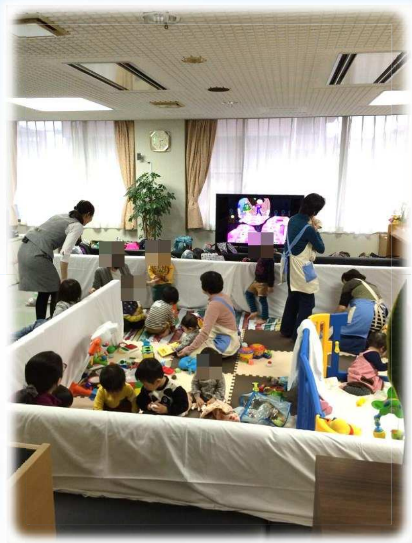
キッズスペースの様子