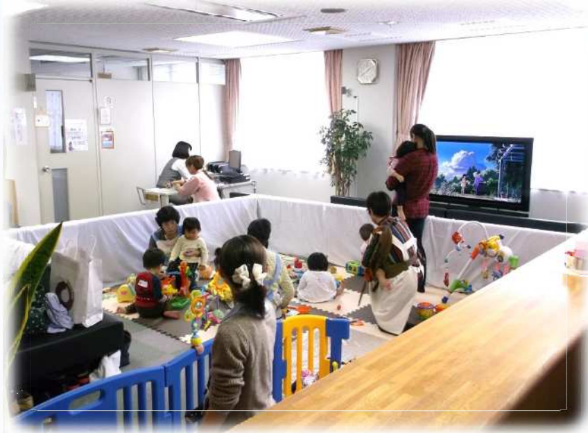
キッズスペースの様子