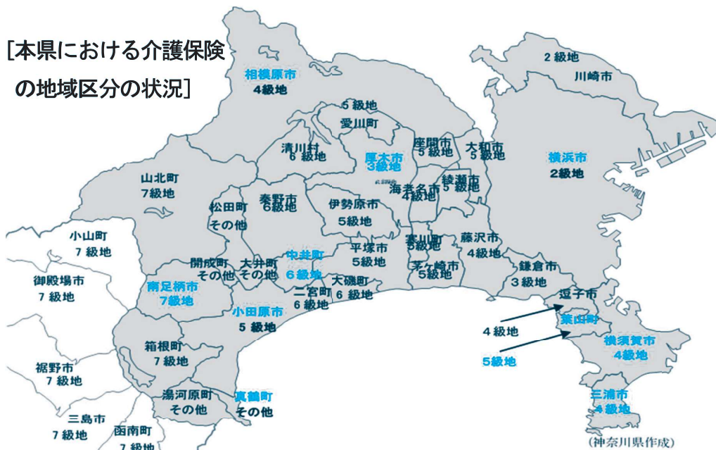
[本県における介護保険 の地域区分の状況]

地域区分を地域の実情に沿って見直すことで、介護保険事業所の経営安定化や人材確保につながる。