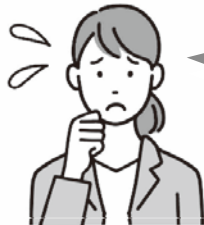
会社の人事労務担当者