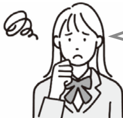
高校生・専門学校生 大学生など