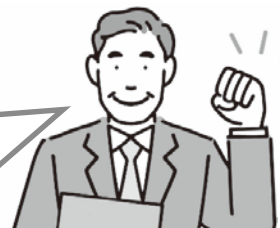
事業主・会社の管理職など