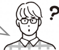
労働組合員・労働組合役員など

かながわ労働センターでは、職員が出向いて、労働問題に関するご希望の内容について説明しています(出前労働講座)。日程や内容についてはご要望に応じて調整しますので、まずはご相談ください。